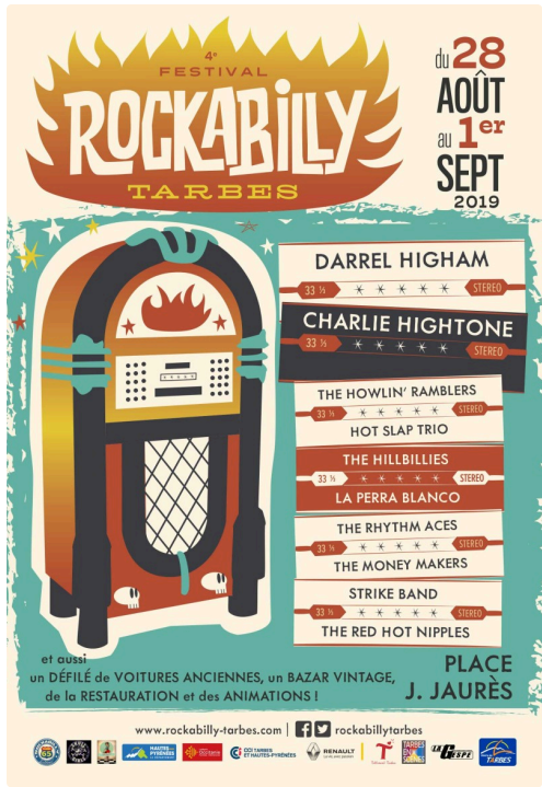
rockabilly tarbes affiche.jpg