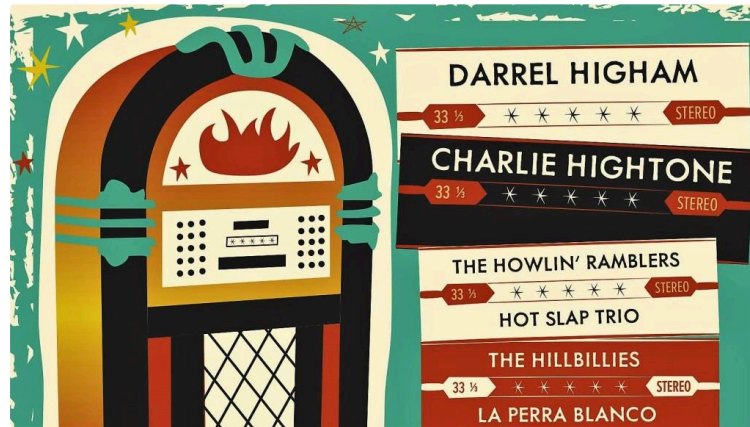
Le festival Rockabilly qui décoiffe

Gomina, jean à revers, corset vichy, perfecto... vous êtes prêts ? Direction le Rockabilly de Tarbes, du 28 août au 1er septembre.