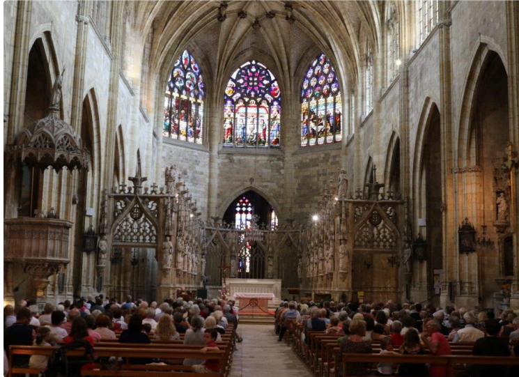
Plein feu sur l'orgue organisé par l'association Plein Jeu

Organisés par l'association "Plein Jeu", les trois concerts centrés sur l'orgue ont lieu à la cathédrale de Condom :