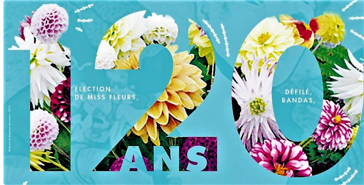
Fête des Fleurs de Luchon : bouquet planétaire pour les 120 ans

Un rendez-vous à ne pas manquer jusqu'à dimanche