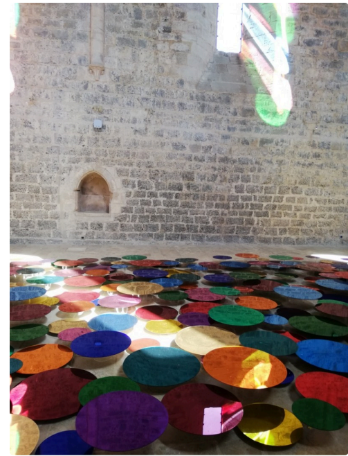
Jeux de miroirs