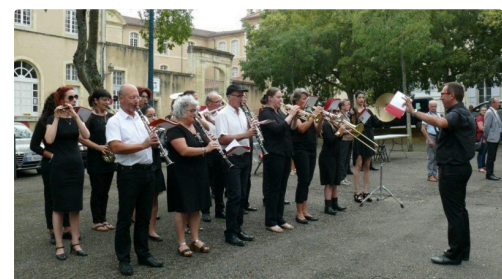
L'ensemble orchestral d'Auch a assuré la partie musicale de la cérémonie.