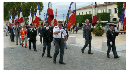
En avant marche, vers le monument aux morts.