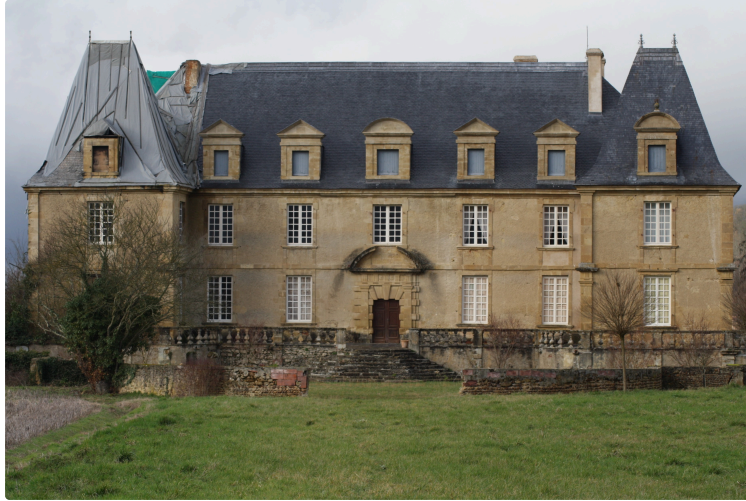
Six siècles d'histoire locale