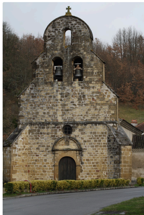
Betplan, l'église Saint Laurent.