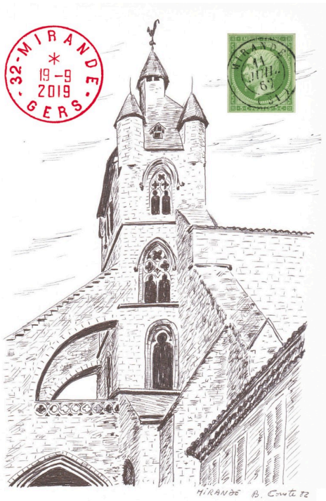
Carte souvenir, dessin Bernard Comte.