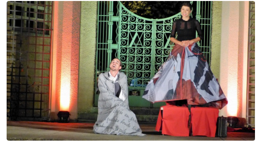
Cyrano et Roxane.