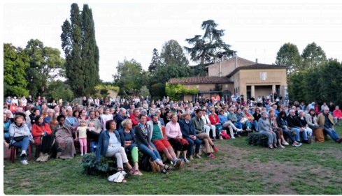
Beaucoup de spectateurs ravis.