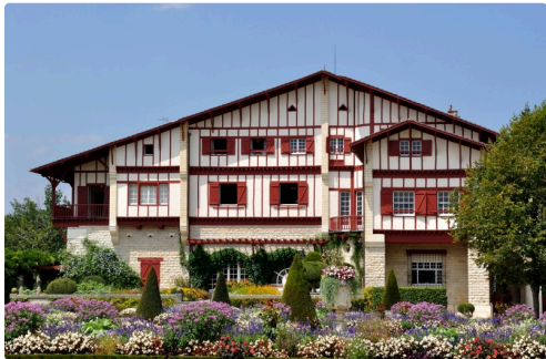
La Villa Arnaga, est la demeure exceptionnelle d'Edmond Rostand à Cambo-les-Bains (64) au Pays Basque.