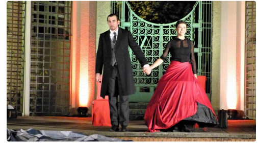
un vrai régal, merci.