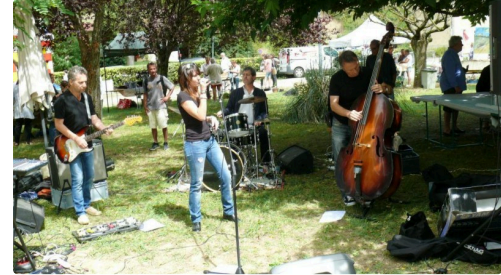
L'orchestre Blue Berry anima la journée.