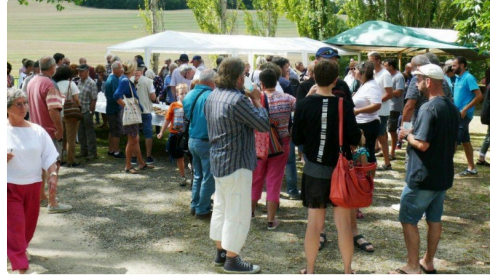
A l'heure de l'apéritif.