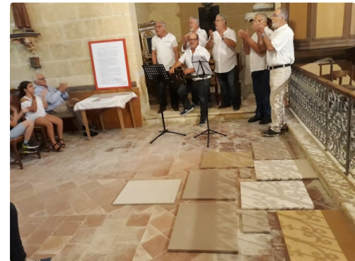
Le chœur de Nauxion chanta au pied de l'oeuvre de Claude Rutault.