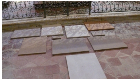
Autel au pied du chœur.

Ces deux bons moments passés, les visiteurs furent invités à l'apéritif offert par la mairie pour ensuite se poser autour d'une table en attendant l'axoa de veau.