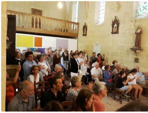
Le public fut emballé par les chanteurs.