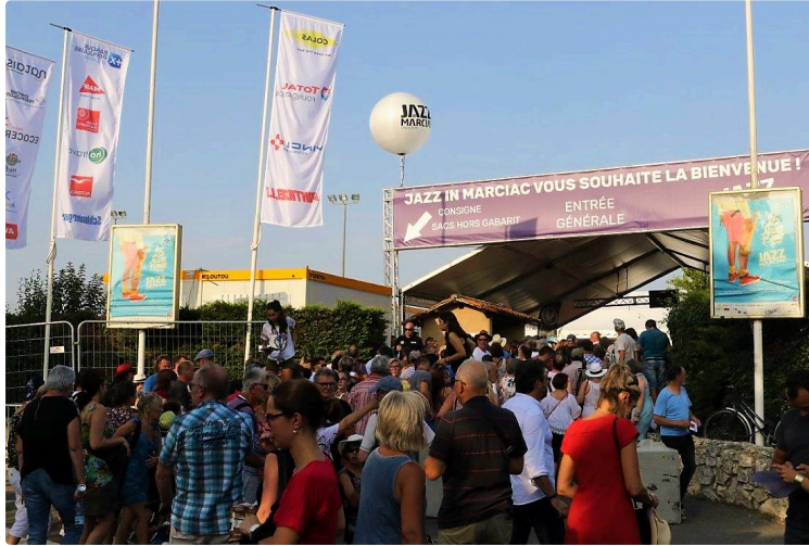
Jazz in Marciac - Le temps du final