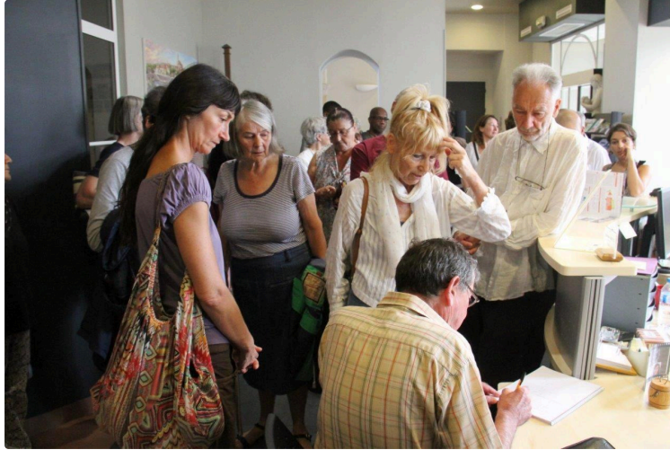
Les Amis des promenades : Un huissier requis pour constater une fin de non-recevoir

L'huissier dresse le constat de non-recevoir.