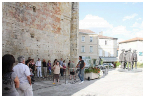
Ils se sont réunis pour mettre un plan d'action en place.