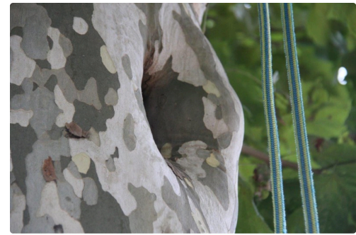
Nid de chauve-souris.