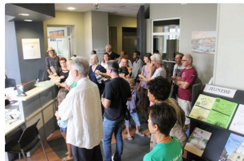
Les membres du collectif dans le hall d'accueil de la mairie.