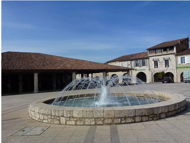
Marchés gourmands nocturnes