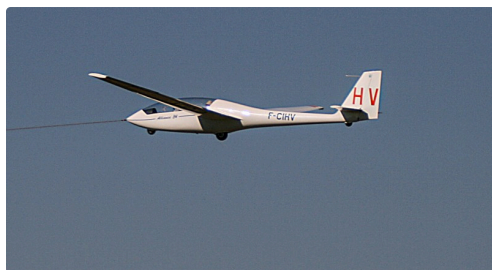
Planeur de l'ACBA en vol

le planeur pour handicapés, obtenu du Conseil départemental grâce au budget participatif 2018, arrive bientôt.