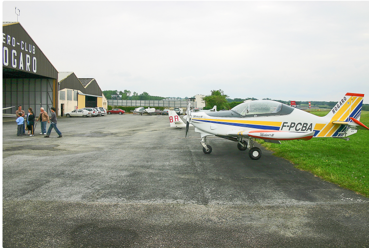
Les brevets de pilotage sont désormais européens à Nogaro

L'aéro-club l'a obtenu de l'European Union Aviation Safety Agency