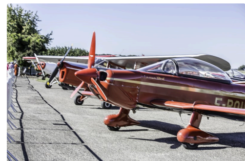
Avions anciens au parking lors d'un Classic festival