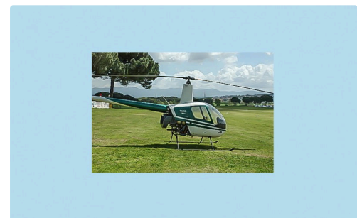
Hélicoptère Robinson R22