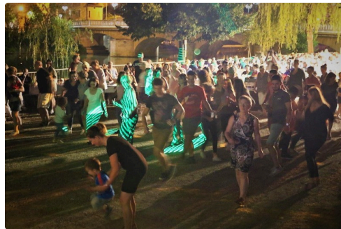
Ensuite on danse