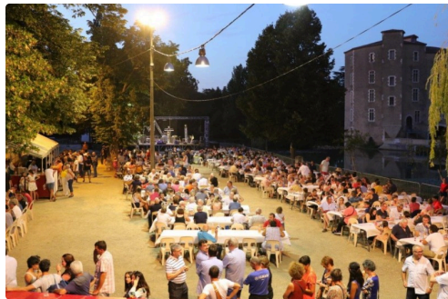
D'abord on mange