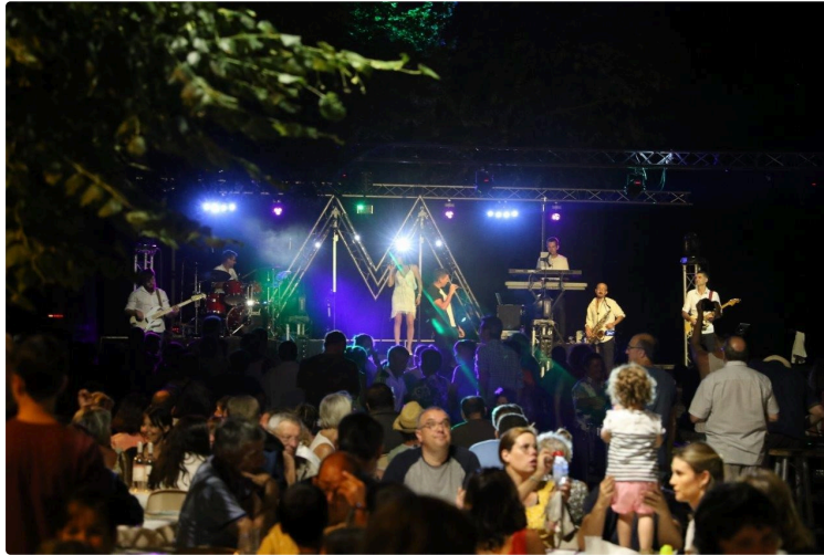
Fête de la Bouquerie : succès d'enfer