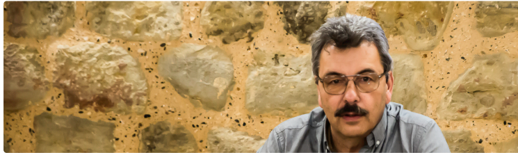
Que promet à la CCAA le Schéma départemental de coopération intercommunale ?

Les communautés de communes vont connaître des changements