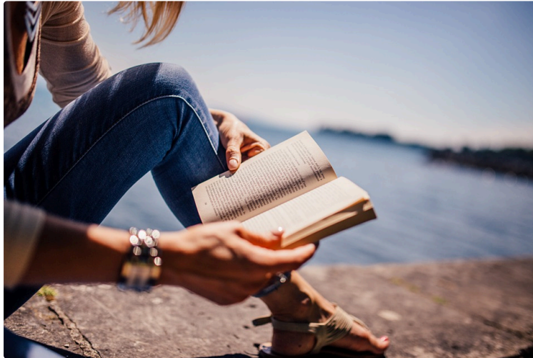
À vos marque-pages !

Chaque premier samedi du mois, le Journal du Gers vous propose une balade chez les libraires et vous révèle leurs coups de cœur du moment.