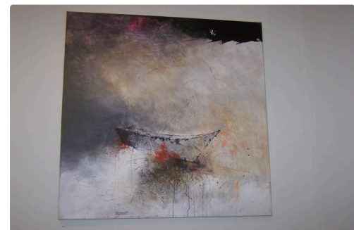
Les Morsures du temps