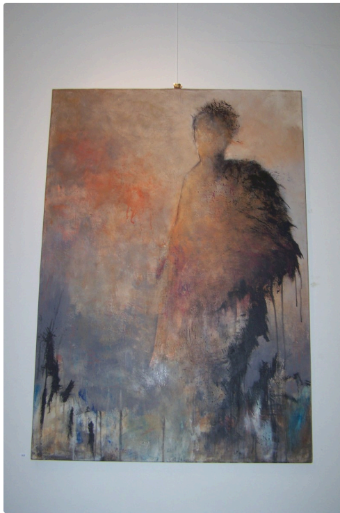
vernissage de isabelle malmezat à L'Arcade 005.JPG