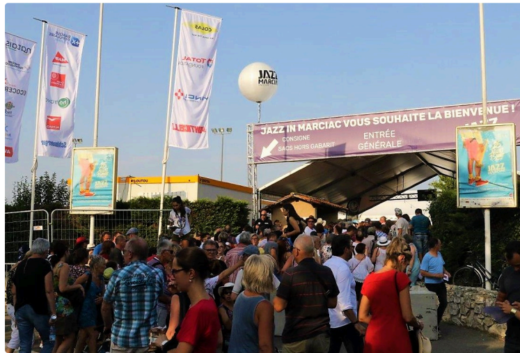
Jazz in Marciac - Fin de semaine avec des stars