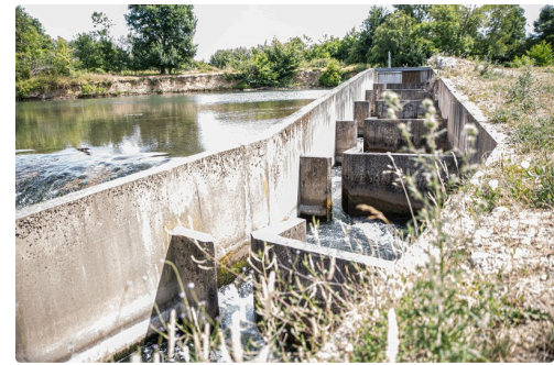
... et sa passe à poissons