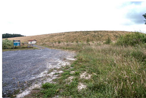
La digue de la Barne