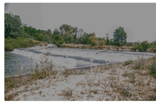
Vue du barrage des Charrutots...