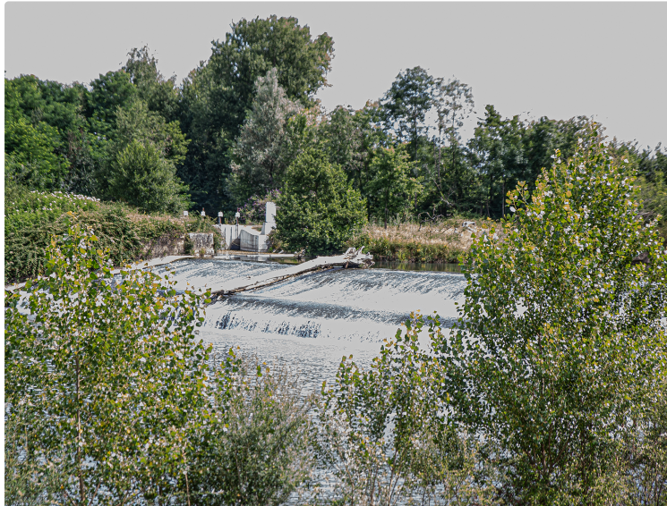
Le contrôle de l'eau et du milieu dans le Gers : une affaire délicate

Le 18 juillet, Le Journal du Gers accompagne trois inspecteurs de l'Agence de la biodiversité en mission de contrôle inopiné du débit « affecté réglementé » par un arrêté préfectoral sur la rivière l'Adour au droit du moulin des Charrutots, à Tieste-Uragnoux (lieu-dit : le Moulin).