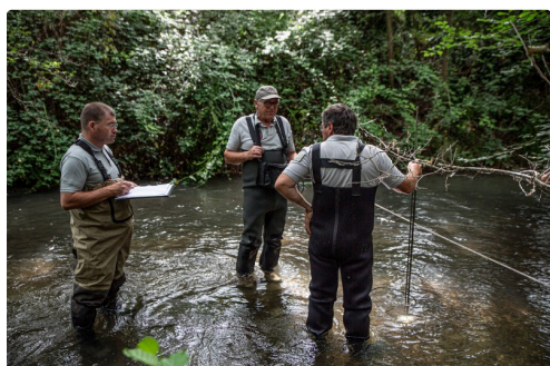
30 mesures du courant sont effectuées avec un courantomètre