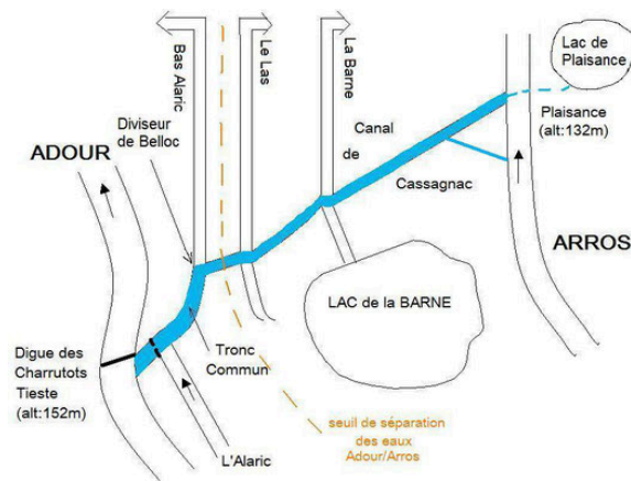
Schéma du système « Cassagnac/Barne » actuel avec le canal en bleu (GascogneRiviereBasse®)

De plus, elle soutient le Plan Ecophyto 2 visant à réduire l'utilisation des pesticides et les atlas de la biodiversité communale (inventaire précis et cartographié des habitats, de la faune et de la flore ; objectif : sensibiliser et mobiliser les élus, les acteurs socio-économiques et les citoyens à la biodiversité ; mieux connaître la biodiversité sur le territoire d'une commune et identifier les enjeux spécifiques liés ; faciliter la prise en compte de la biodiversité lors de la mise en place des politiques communales ou intercommunales. (2) Chef du Service départemental du Gers de l'AFB. (3) Données communiquées par les inspecteurs et complétées avec le site ( https://gascognerivierebasse.jimdo.com/patrimoine-et-géo/hydrographie/le-canal-de-cassagnac/ ).