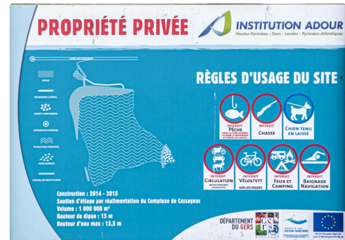
Panneau avec le plan du site de la Barne