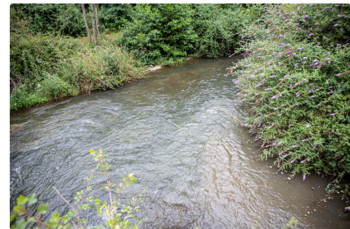
Mélange de l'eau (un peu boueuse à droite) des Pyrénées et de celle de l'Adour