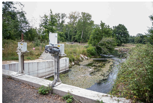
Les vannes du site des Charrutots