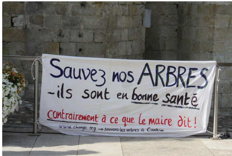
Les Amis des arbres toujours mobilisés

Nouvelle réunion d'information pour ce jeudi