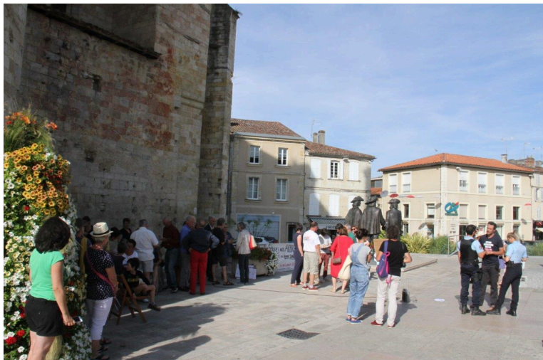
Discussion sans conséquence avec les policiers municipaux ...