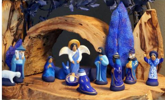
LAVARDENS Les Santons à la fête

Une exposition devenue incontournable pour petits et grands