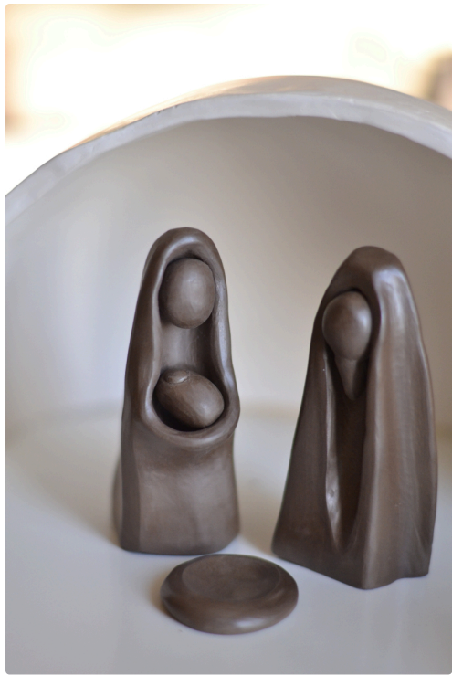
Santons FRAPOLLI de Bagnol sur Cezes (30)