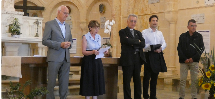
Deux belles expositions à l'église et à la chapelle

Pendant le festival de jazz, tout Marciac prend une dimension de niveau international du fait de cette grande manifestation qui voit un village de 1.300 habitants décupler sa population en quinze jours.