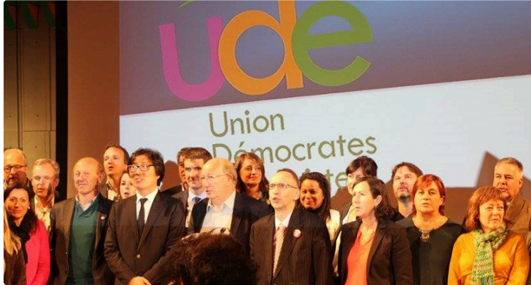
L'UDE NOUVEAU PARTI

Le Front démocrate et Ecologistes! fondent l