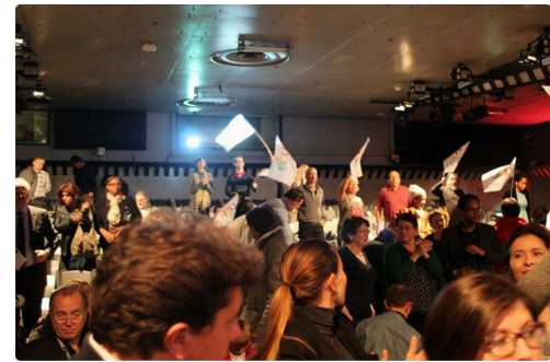
FIN de la manifestation