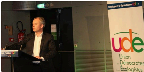
François DE RUGY