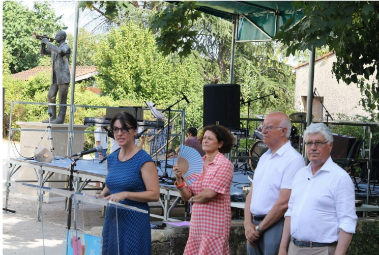
Jazz In Marciac : chaud devant !

Top départ du 42ème festival inauguré hier soir