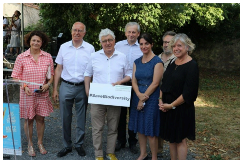
La biodiversité au coeur des débats