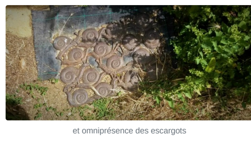
et omniprésence des escargots