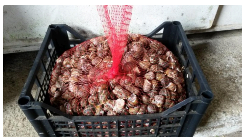
Prêts à trouver acquéreurs ce soir