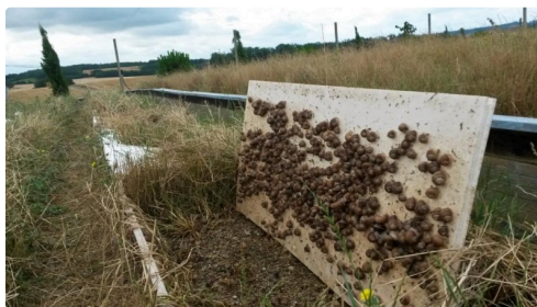
Dérangés dans leur grasse matinée, à l'abri de la chaleur, le temps d'une photo