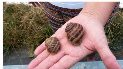
Petit et Gros gris recto