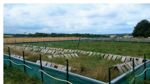
Le deuxième parc au repos pour l'instant