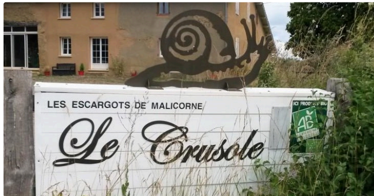
Surprenants escargots de Malicorne !

Tout ce que vous avez toujours voulu savoir sur les escargots, sans jamais oser le demander