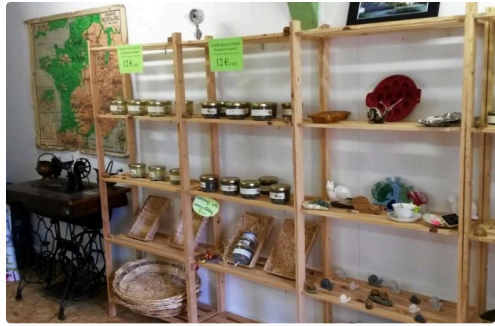
Faites votre choix