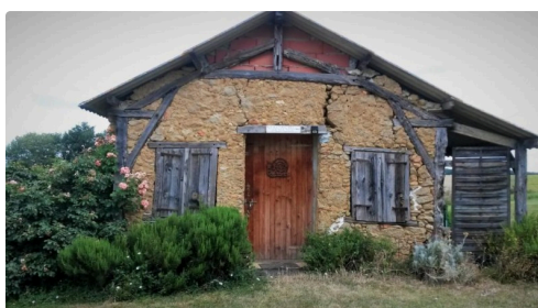
La boutique, aux allures traditionnelles gasconnes