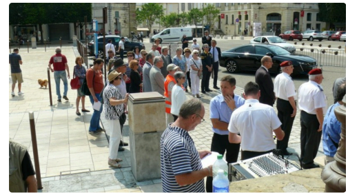
Une partie de l'assistance à la cérémonie.