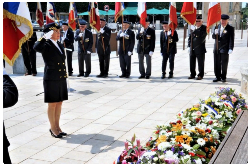
La préfète Catherine Séguin se recueille devant les plaques souvenirs. (Photo Serge Souques).