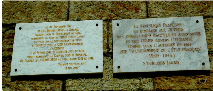
Hommage aux victimes racistes et antisémites et aux Justes