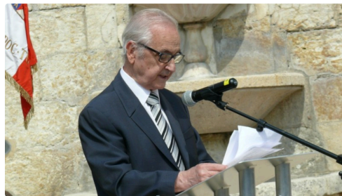
Le docteur Jean-Claude Nabet, du conseil représentatif des institutions juives de France.