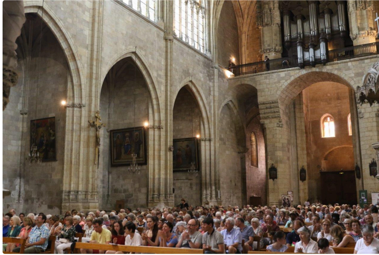
Le retour des Vespérales à la cathédrale Saint Pierre

Un concert auquel on regrette de ne pas avoir assisté ! Tant le public présent a été conquis par la prestation des deux interprètes !