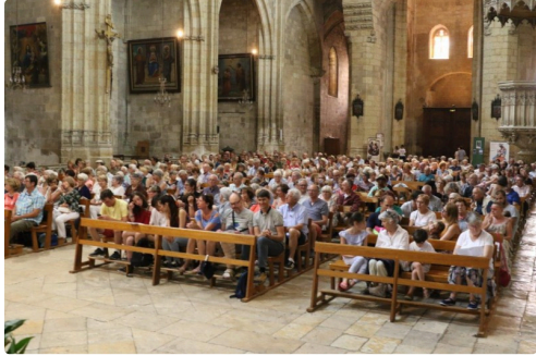
Vespérales 16 juillet 2R6A8716.jpg