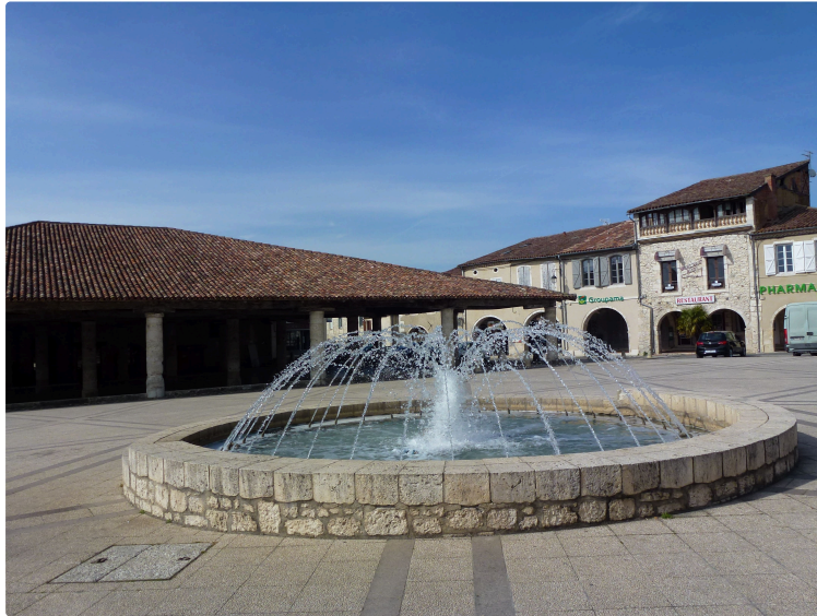
Marché nocturne gourmand : ça commence jeudi 25 juillet !

Cette année, le foyer rural propose trois marchés gourmands. Ce sera l'occasion d'innover avec deux artistes et une banda.