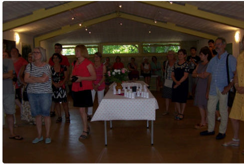
Le public lors du vernissage