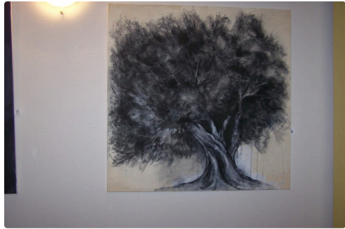
" L'olivier "