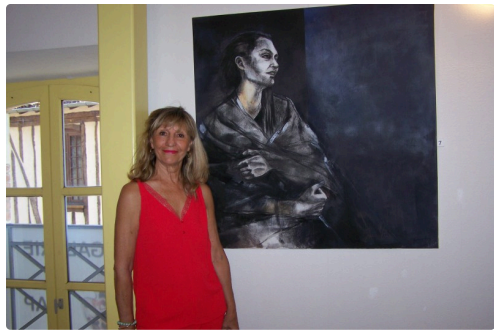
Devant " Bruissement "