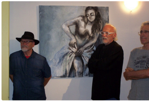
"Le bain bleu"