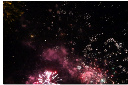
Condom 14 juillet 2R6A8641.jpg