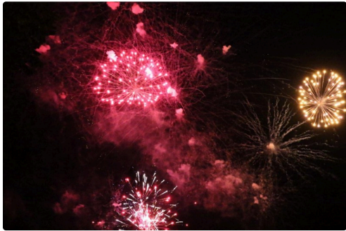
Condom 14 juillet 2R6A8643.jpg