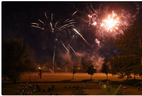
Condom 14 juillet 2R6A8558.jpg