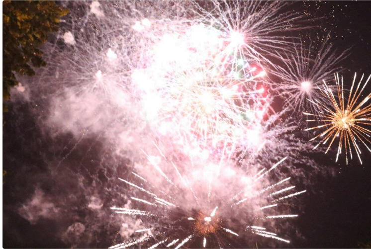
Encore de quoi écarquiller les yeux d'admiration !

Avec le feu d'artifice tiré dans le parc de Gauge