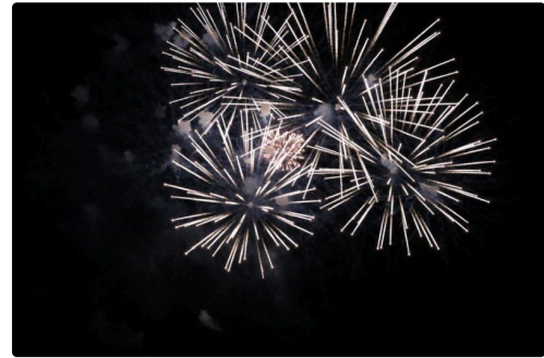
Condom 14 juillet 2R6A8653.jpg