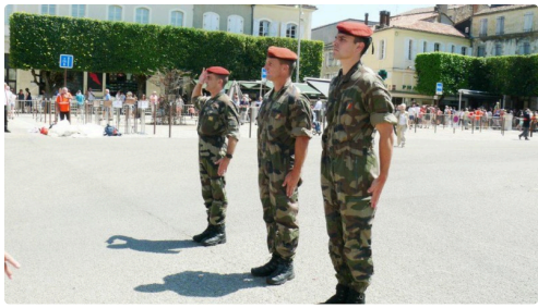
Les trois parachutistes du 35ème régiment d'Artillerie parachutiste de Tarbes.