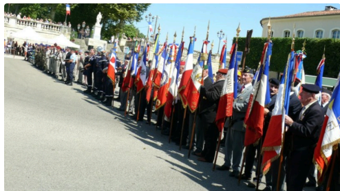
25 porte-drapeaux honoraient de leur présence la cérémonie.