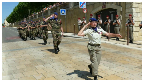
Défilé du détachement du 5ème régiment d'hélicoptère de combat.