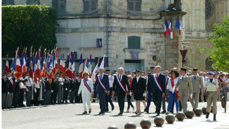
Une cérémonie du 14 juillet de haute tenue

C'est à la seconde près, à 11 h 40, que les trois avions Rafale ont survolé la place de la Libération d'Auch, lors de ce 14 juillet. Moment qui fut le top départ de la cérémonie ouverte par la préfète du Gers, Catherine Séguin, qui avait à ses côtés les nombreux élus du département, les autorités civiles, militaires, religieuses, de la gendarmerie, et des pompiers.