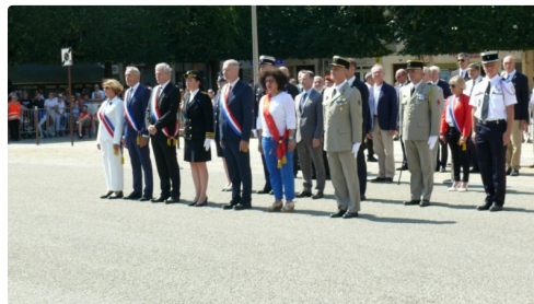
Les autorités civiles et militaires.