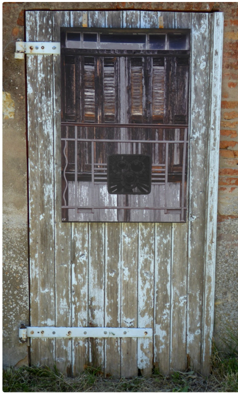
Image de belle porte ancienne montée sur une porte ancienne usée par le temps