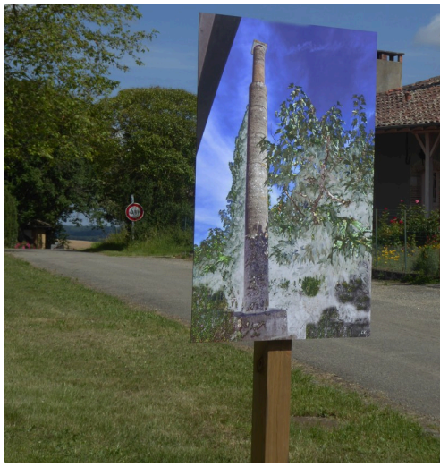
La vieille tour