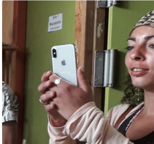
Gendarmerie Gers : Appel à témoins