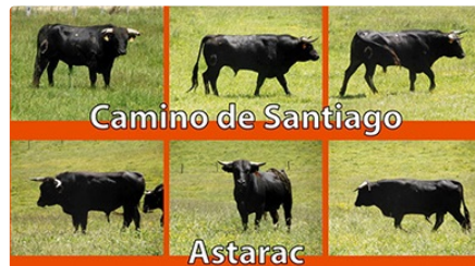
Novillada du 14 juillet