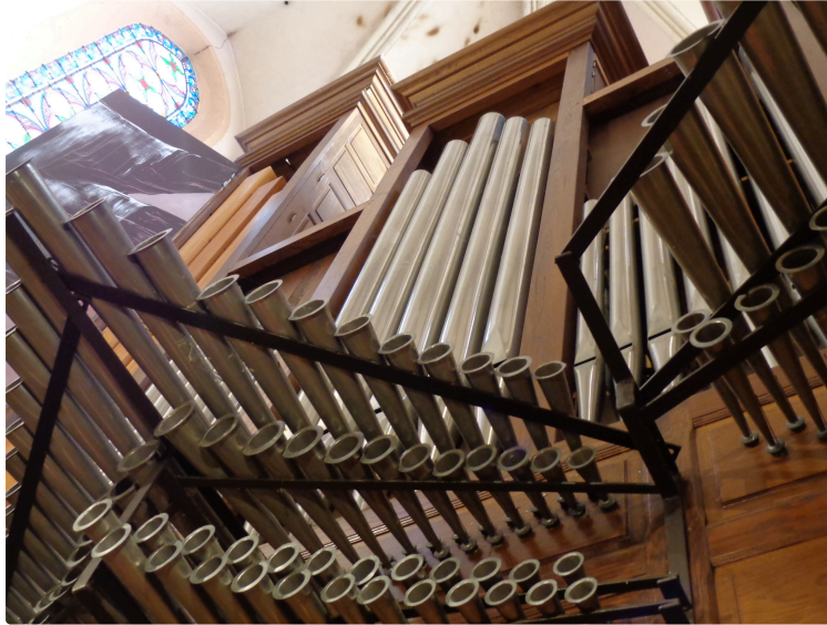
Orgue Culture et Musique en Val d'Adour

Très bientôt commenceront les Estivales d'Orgue 2019.