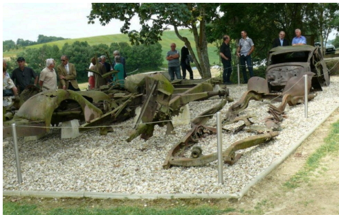
Ce qu'il reste du matériel militaire.