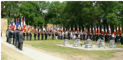
La cinquantaine de porte-drapeaux autour de la stèle.