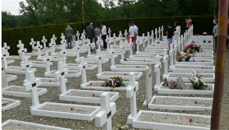
Commémoration de Meilhan : 75 ans après, l'émotion est toujours aussi intense