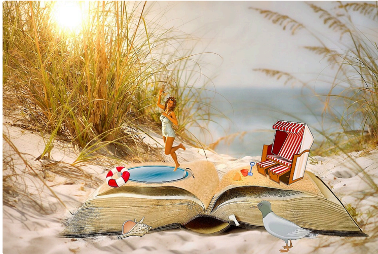
À vos marque-pages !

Chaque premier samedi du mois, le Journal du Gers vous propose une balade chez les libraires et vous révèle leurs coups de cœur du moment.