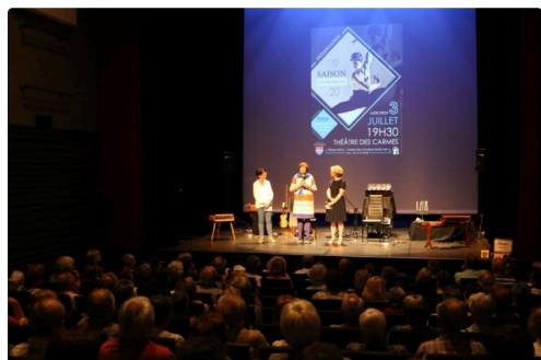
Carmes 3 juillet 2R6A7904 (2).jpg