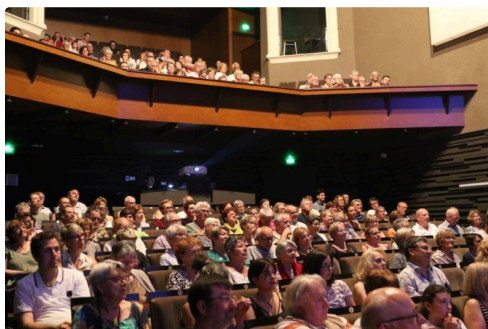
Carmes 3 juillet 2R6A7912 (2).jpg