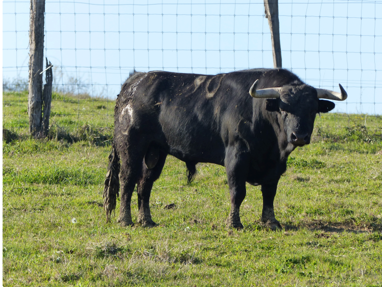
Les toros de la ganaderia de Bars - Jean-Louis Darré

Au palco, le président de la commission technique sort le mouchoir blanc, les clarines sonnent, le mayoral local ouvre la porte du chiquero au premier toro de l'incaste Camino de Santiago.