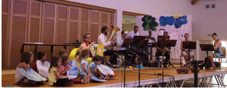
Le monde merveilleux de Coqueline

Mardi en fin d'après-midi, au Pôle culturel, le public a découvert le conte musical Coqueline.