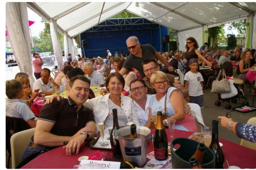
Repas de l'afficion