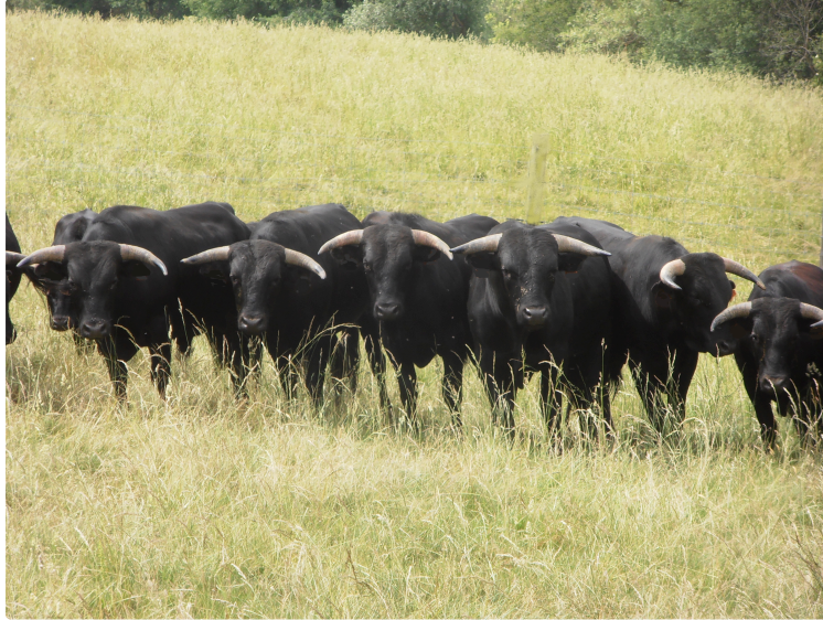
La commune en fêtes du 11 au 14 Juillet

Spectacles dans les arènes durant les quatre jours