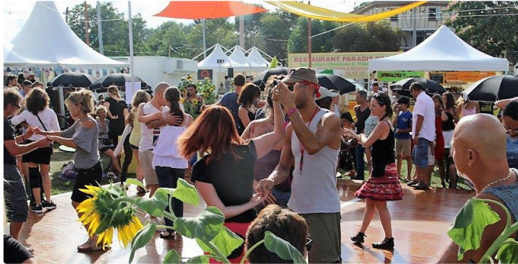
Tempo Latino - Le off à l'ombre des arènes