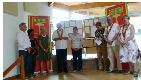
Les personnalités au moment des discours.