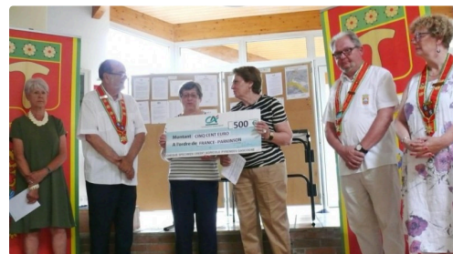
Un don de 500 euros pour France Parkinson.

(2) L'Association France Parkinson a été créée en 1984 et reconnue d'utilité publique en 1988, elle se donne pour buts de :