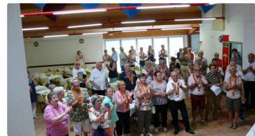
Les membres des anysetiers.