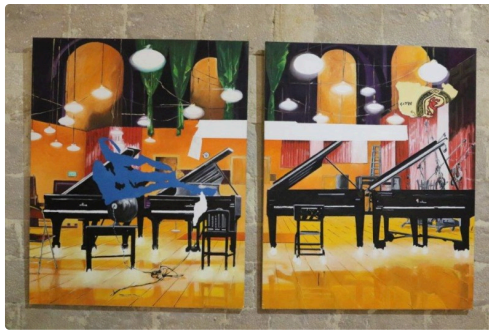
"Toujours la même chaise " (2012)