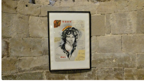
Jim Morrison le chanteur des Doors.