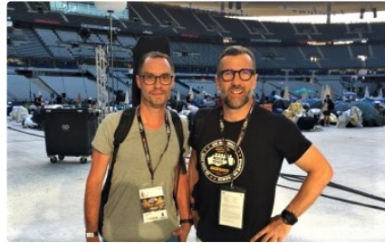
Ils ont vécu le grand frisson Rockin'1000

C'est une fabuleuse sensation qu'ils viennent de vivre et qu'ils garderont précieusement dans leur cœur comme une belle pépite gorgée d'énergie.