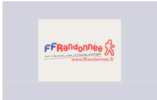
Estivales 2019 avec les Randonneurs Gascons d'Auch

Les randonneurs gascons d'Auch organisent les Estivales 2019.