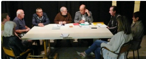
Le bureau du Castella finalise le programme des Automnales.