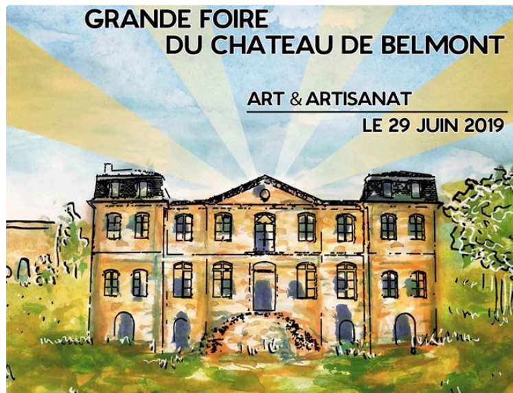
Grande foire au Château Neuf des Peuples

Le 9 juin 2018, Camille Lecoer et Léo Ferreira ouvraient grand les portes de leur Château Neuf des Peuples à Belmont, à tous ceux qui souhaitent visiter leur chantier et discuter autour de la rénovation de ce vaste bâtiment datant du XVIIe siècle.