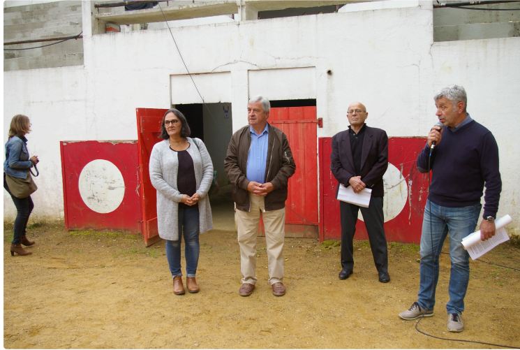
L'exposition Balta a été inaugurée

Organisée par la Peña Vivement Cinq Heures