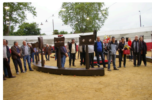
Public d'aficionados pour le vernissage