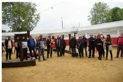
Beaucoup étaient venus des extérieurs à Plaisance