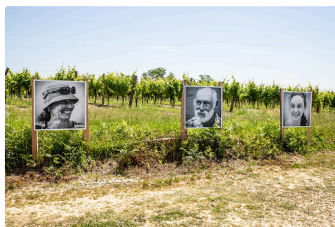
Portraits le long du chemin