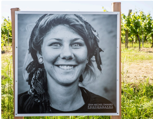
8 Un portrait 1bis 160619.jpg