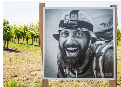
9 Un portrait 1bis 160619.jpg