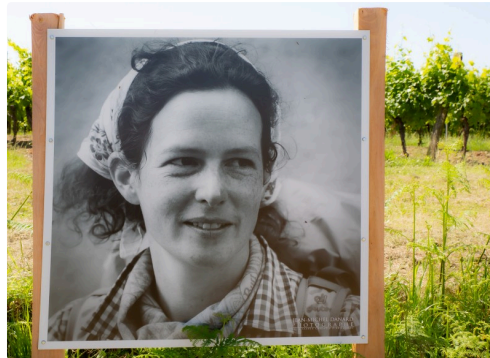
11 Un portrait 1bis 160619.jpg