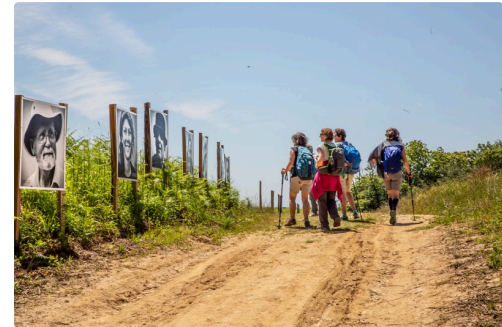
Deux jours avant l'inauguration, des pèlerins face aux photos de pèlerins