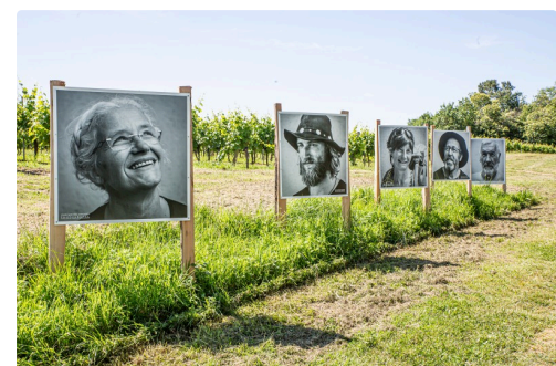
Les derniers de la série