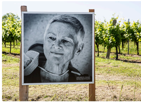
10 Un portrait 1bis 160619.jpg