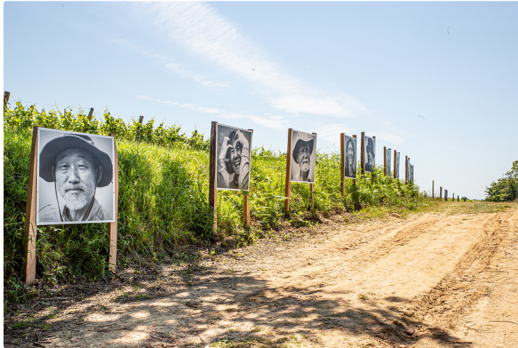
« Portraits sur le chemin » à Sainte-Christie-d'Armagnac

Saisissante expo gratuite de Jean-Michel Danard